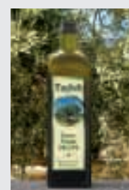
Taybeh Extra Virgin Olive Oil