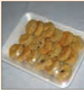
Sweets filled with dates