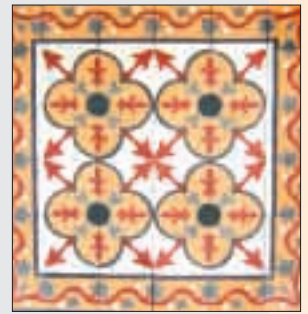
Antique Floor Tile