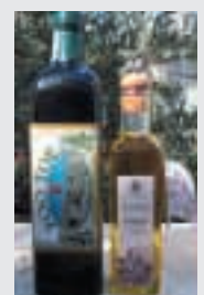
Taybeh Olive Oil Taybeh Olive Press