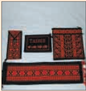
Hand Made Embroidery