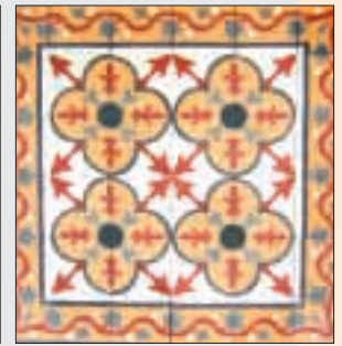
Antique Floor Tile