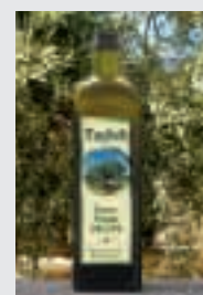
Taybeh Extra Virgin Olive Oil