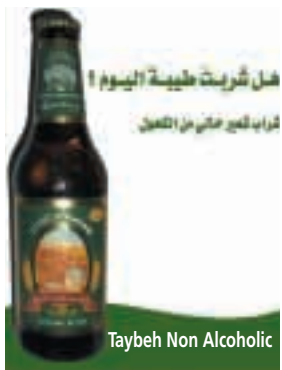
Taybeh Non Alcoholic